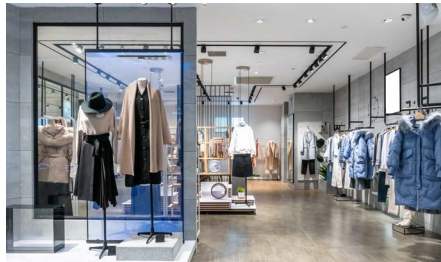
Einzelhandel & Gewerbe