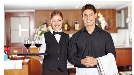
Gastronomie & Hotel