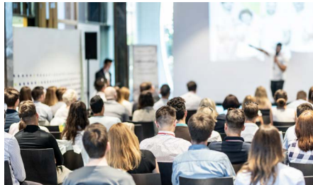
Veranstaltungen & Messe